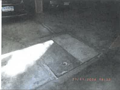
รูปที่ 7 ระบบบำบัดน้ำเสียแบบตะกอนเร่ง (Activated Sludge)