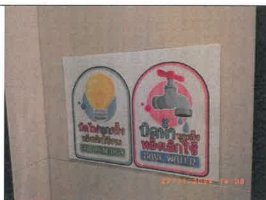
รูปที่ 11 รณรงค์การใช้น้ำอย่างประหยัด