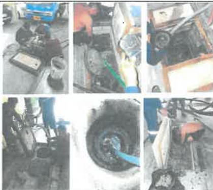
รูปที่ 9 การกำจัดไขมันออกจากบ่อดักไขมัน