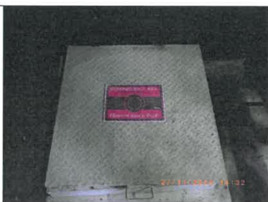
รูปที่ 12 ป่อทวงน้ำใต้ดิน