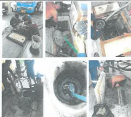
รูปที่ 8 การสูบน้ำตะกอนส่วนเกินจากระบบบำบัดน้ำเสีย