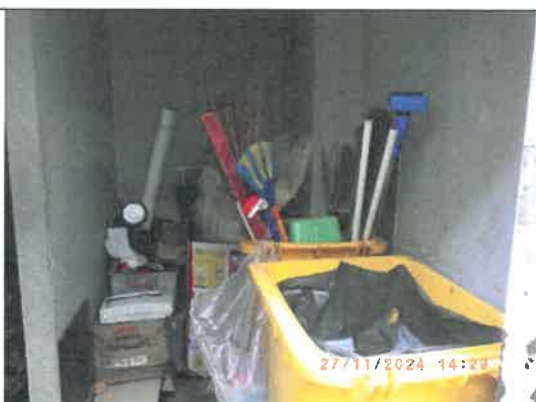
รูปที่ 13 ห้องพักมูลฝอย