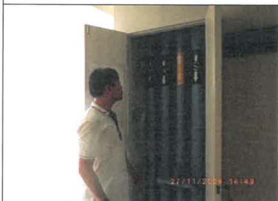
รูปที่ 10 เจ้าหน้าที่รักษาระบบเส้นท่อ