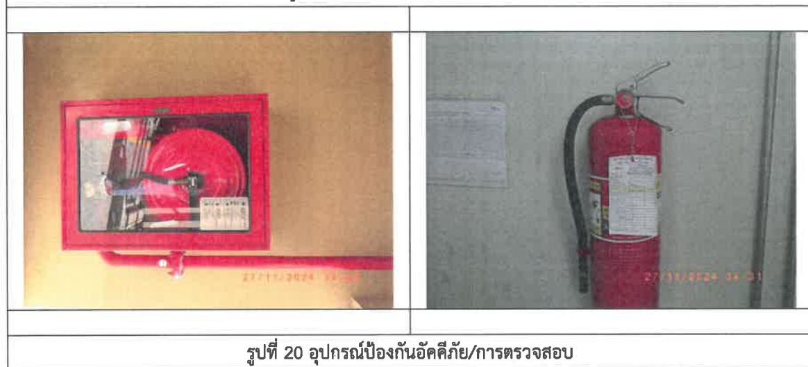
รูปที่ 20 อุปกรณ์ป้องกันอัคคีภัย/การตรวจสอบ