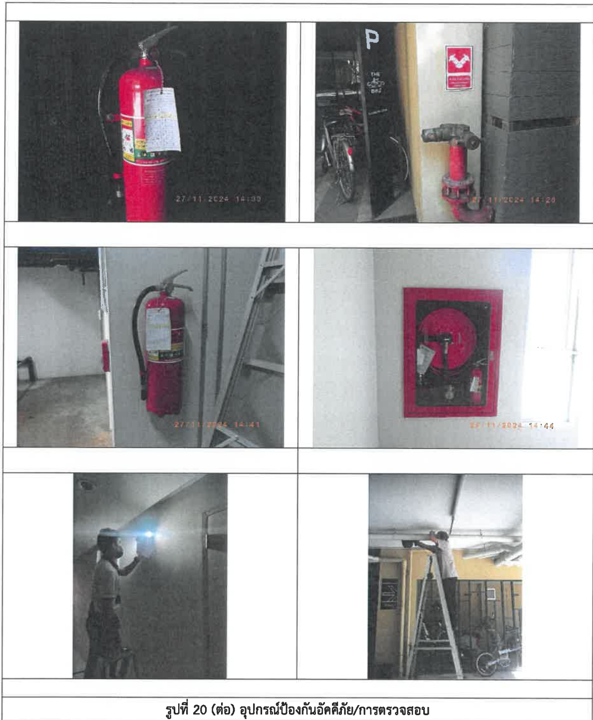
รูปที่ 20 (ต่อ) อุปกรณ์ป้องกันอัคคีภัย/การตรวจสอบ